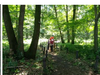
草刈り作業後のB地区（通路は、ほうきできれいに掃く）