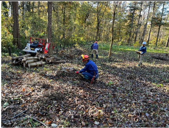
B地区林内整理作業中