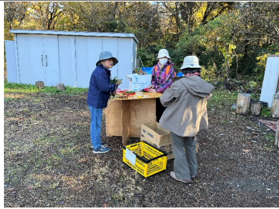
クリスマスリース準備作業中

次回の予定： 定例活動9:00～ 12月6日（土）イヌシデ広場集合 12月13日（土）イヌシデ広場集合 イベント： 当面なし