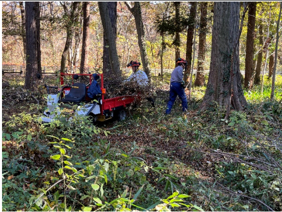
B地区林内整理作業中