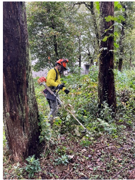
A地区下草刈り作業中