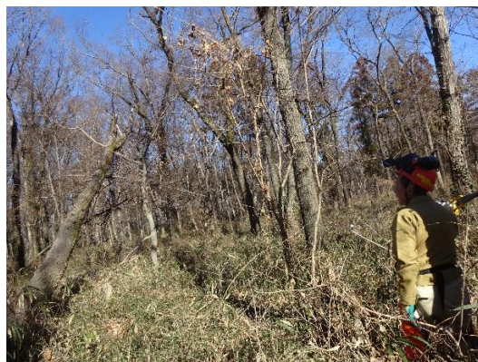
A地区枯損木の倒木(かかり木)