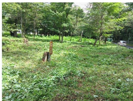
どんぐりの里の草刈り