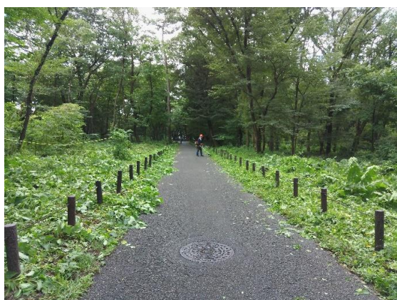
「緑の祭典植樹地」の隣接部を草刈り