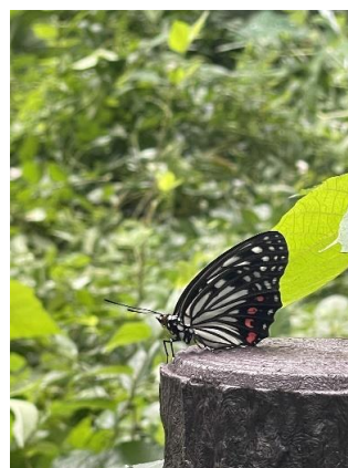
アカボシゴマダラ (特定外来生物)

次回の予定：定例活動9:00～ 9月7日(土) イヌシデ広場集合 9月14日(土) イヌシデ広場集合 イベント： 9月7日(土) 三菱電機株CSR活動 ☆ボランティア募集・経験不問☆ 第1土曜、2土曜、3日曜、4水曜の中 から好きな日の午前に参加可。活動日 の朝9:00前に長袖で来て下さい。