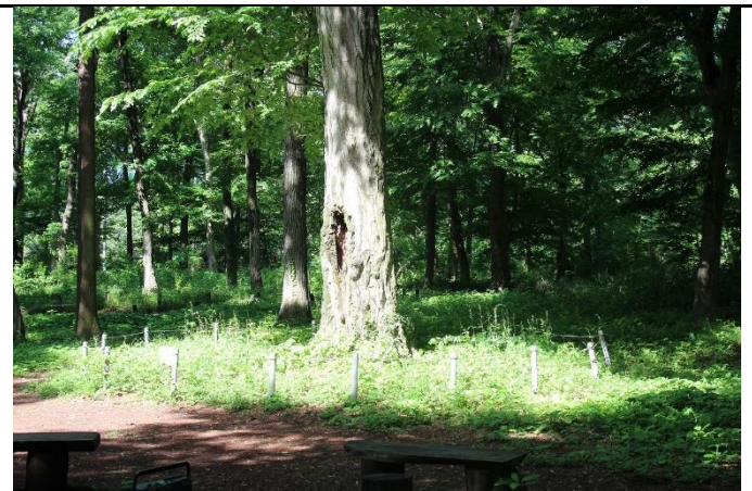
イヌシデ広場のシンボルツリー、「イヌシデ」