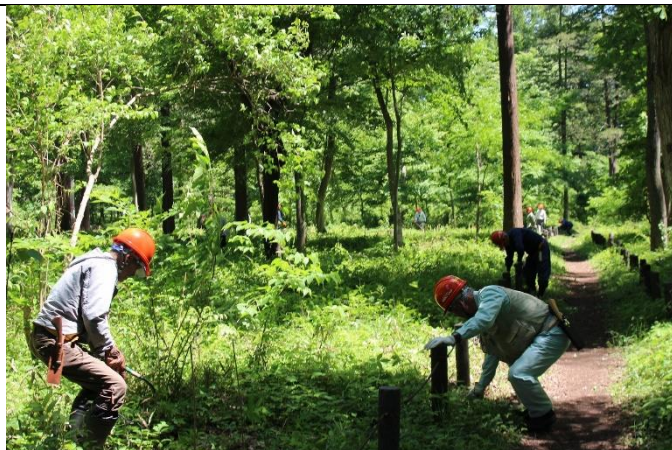
刈払機の前に、手鎌で壺刈りをする