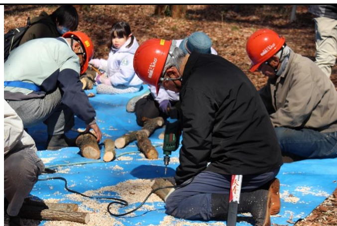
椎茸菌を蔓延させた種駒を打ち込むため、原木に穴を開ける