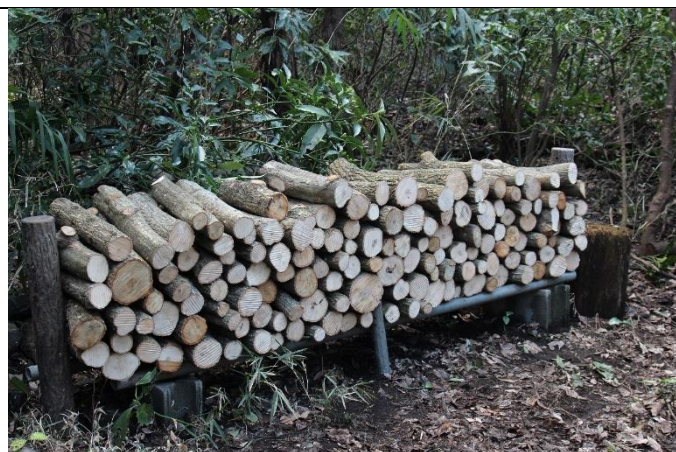
ホダ木は仮伏せし、寒冷紗をかけ暑湿する