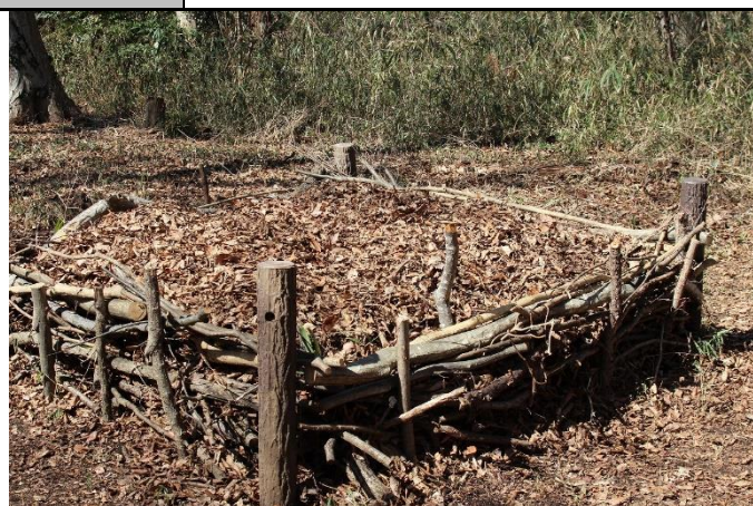
堆肥場の四隅に疑似木を立て、補強した