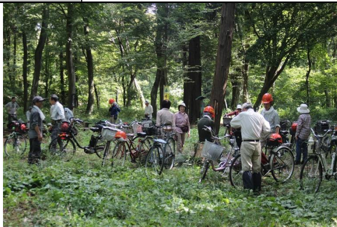
多くの会員が、自転車で参加される