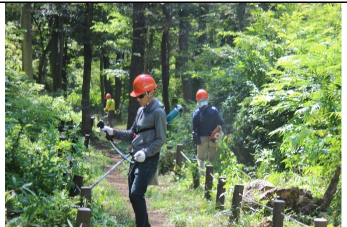
散策路の少し外側まで、草刈りを心掛ける