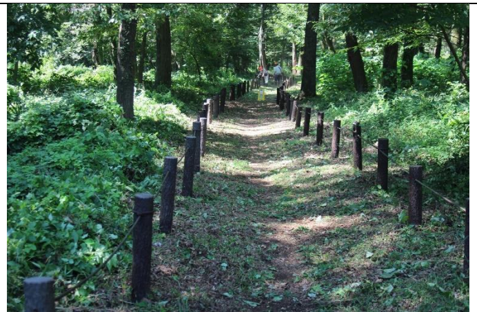
いつもゴミひとつ落ちていない、愛される散策路