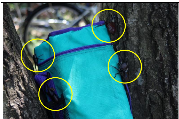
たくさんのカブトムシやクワガタが採れた