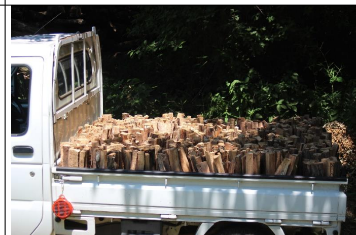
キャンプ場に40束の薪を納入した

次回の予定：定例活動9:00～ 7月26日(水) イヌシデ広場集合 8月20日(日) イヌシデ広場集合 8月23日(水) イヌシデ広場集合 イベント： 9月16日(土) 一日研修