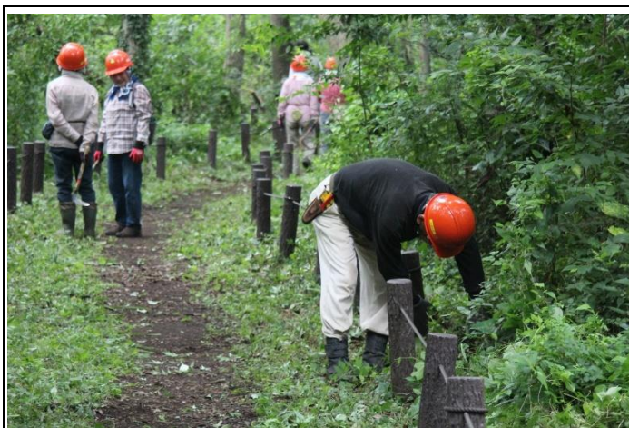
休憩時間だが、切りの良い所までと作業を続ける会員