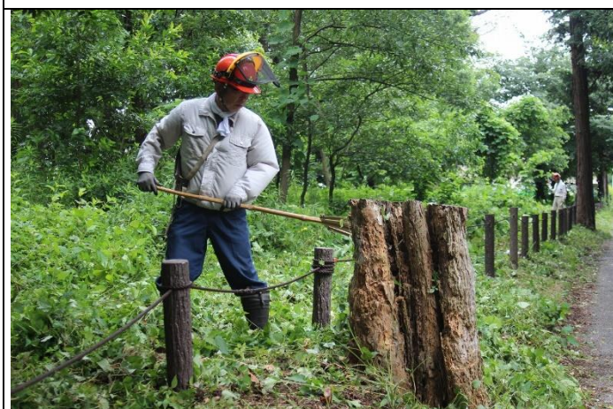
D地区は夏祭り会場に隣接している