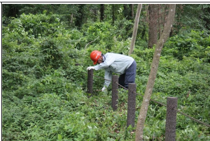
杭周りは手作業が欠かせない