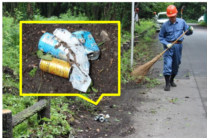
道路沿いの森の中からは、多くの空き缶が出てきた