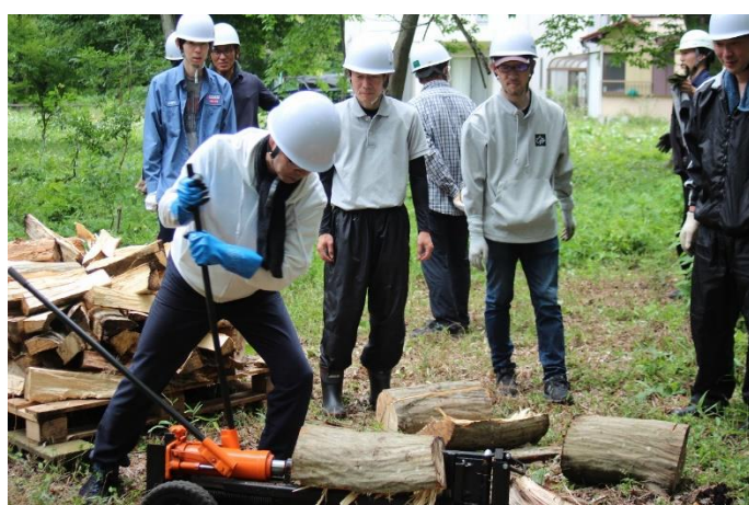
伐木処理材の利活用として、薪割りに協力いただいた