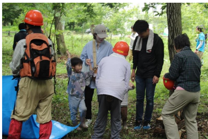
親子参加者には、森の自然を体験いただいた