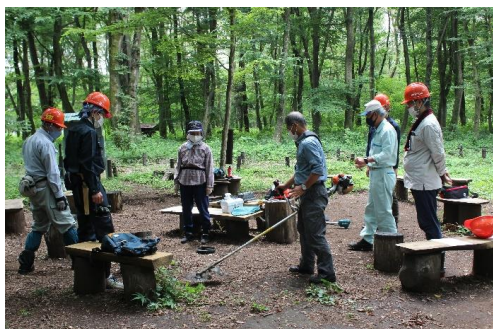
① 刈払機安全講習会