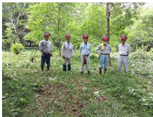
D地区の下刈り終了