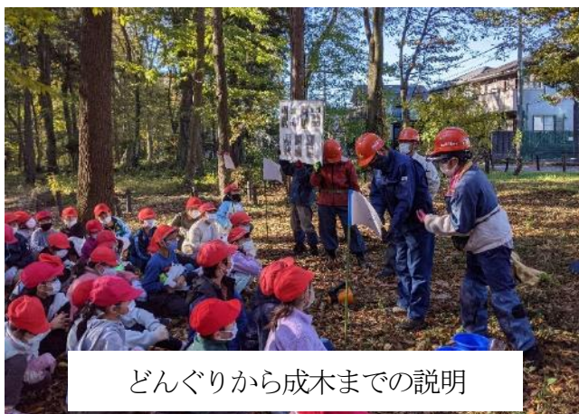
どんぐりから成木までの説明