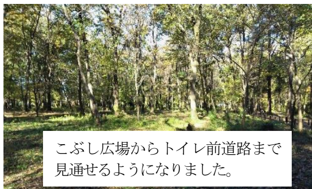
こぶし広場からトイレ前道路まで見通せるようになりました。