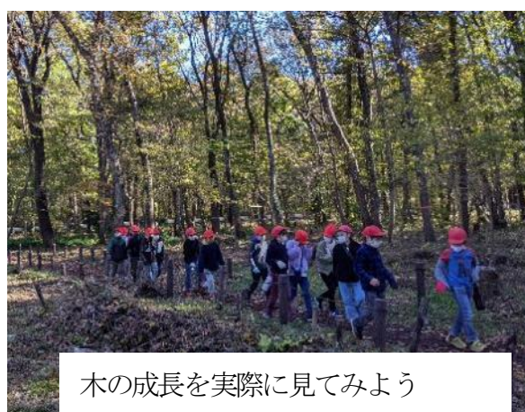
木の成長を実際に見てみよう