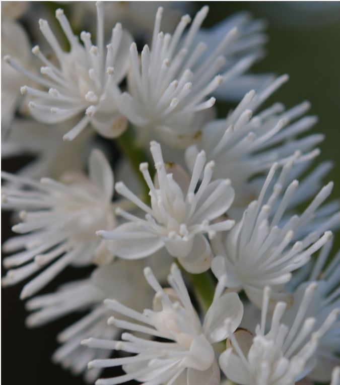
サラシナショウマ (キンポウゲ科)

両性花と雄花があり、白い糸のように見えるのが雄しべの花糸です。萼片は楕円状舟形、先が浅裂しているのが花弁です。