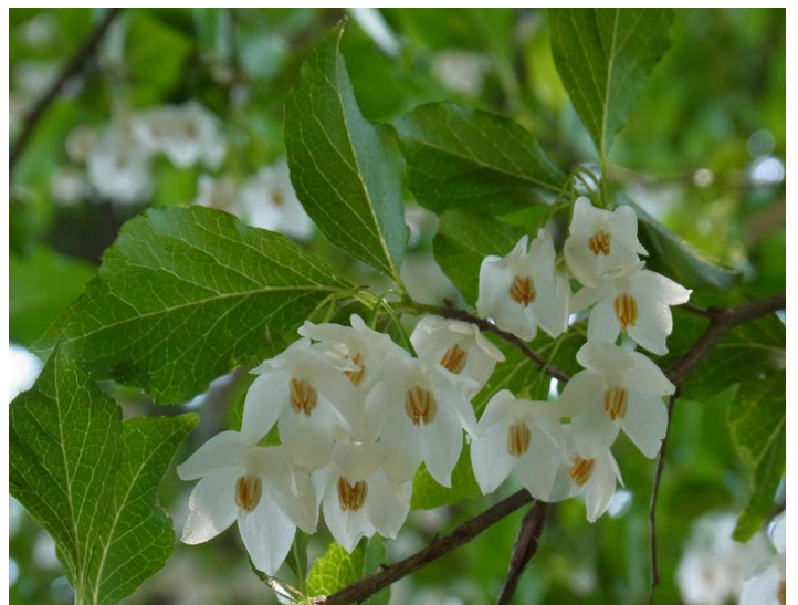
エゴノキ (エゴノキ科) 落葉小高木。高さ 7-8 m