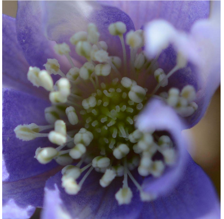
キクザキイチゲ (キンポウゲ科) 雄しべ、雌しべは多数