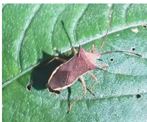
ホソハリカメムシ