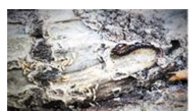
シロアリとムカデ (樹皮の下)