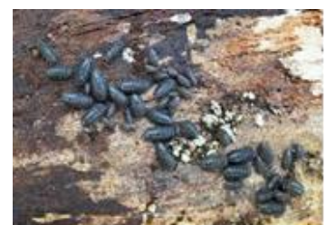
ダンゴムシ集団(樹皮の下)