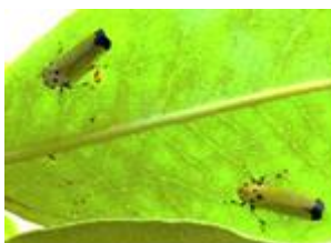
ツマグロオオヨコバイ (葉の裏)