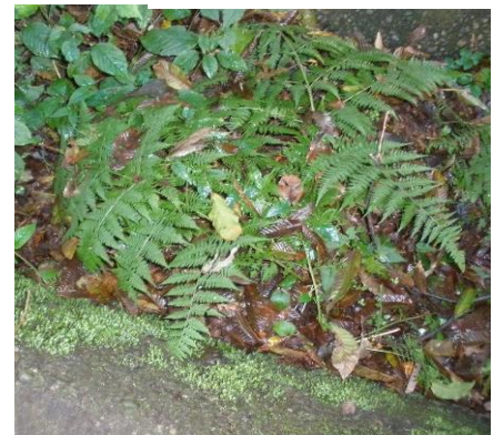
ミヤマイタチシダ

孢子嚢群は葉身の上半分に生じ小羽片の中脈ぞいに並ぶ 羽軸にはほとんど鱗片は残らない