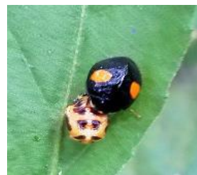
テントウムシと抜け殻