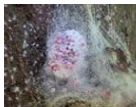
ジョロウグモの卵塊