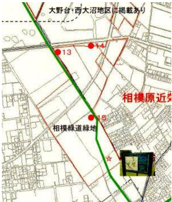
麻溝台・西大沼地区