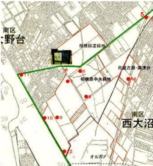
大野台・西大沼地区